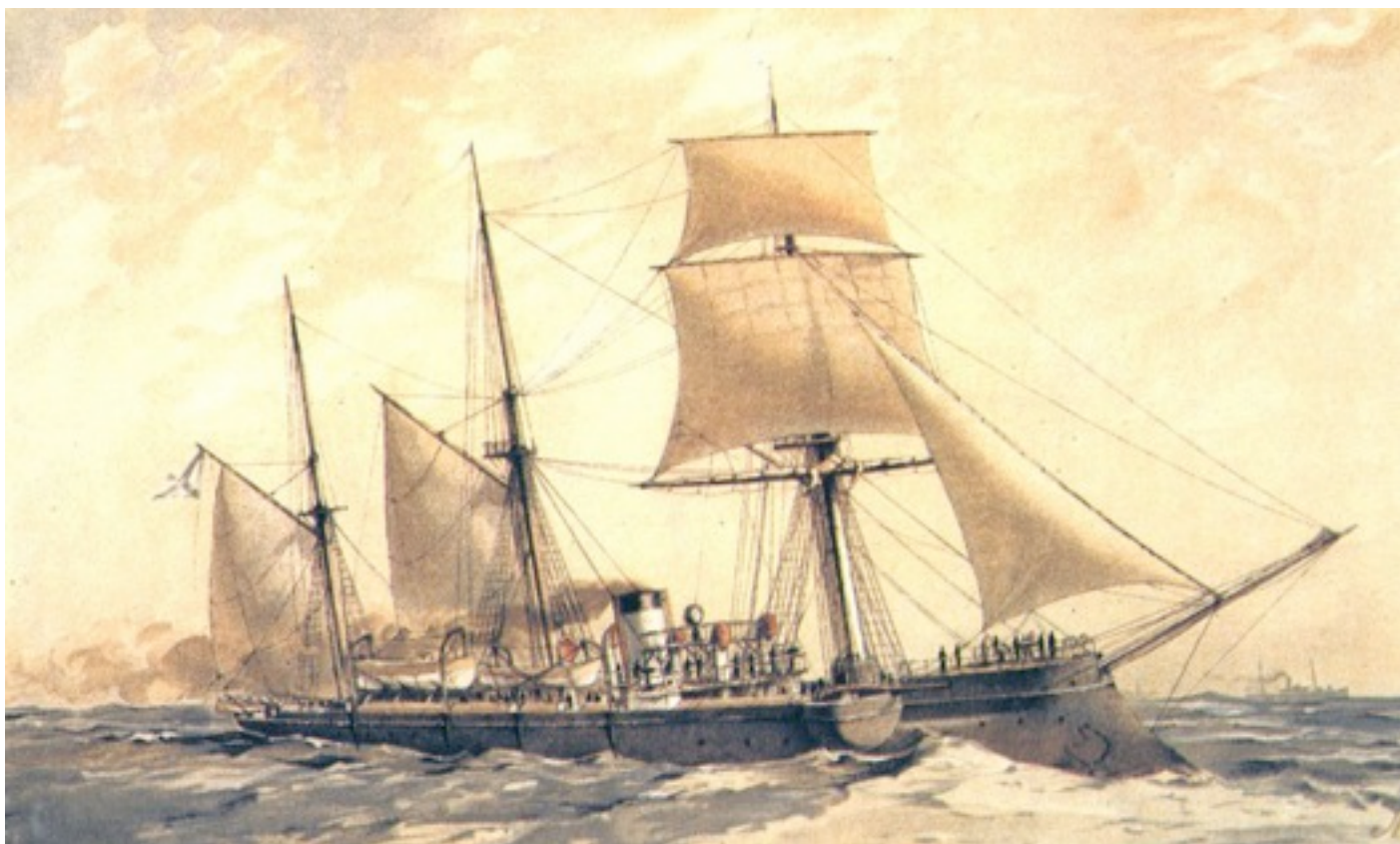
Канонерская лодка «Кореец». Хромофотография. Кон. XIX в.