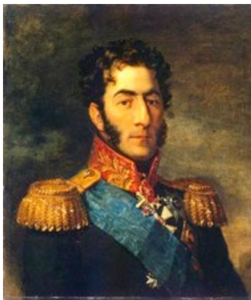
Портрет П.И. Баграциона.