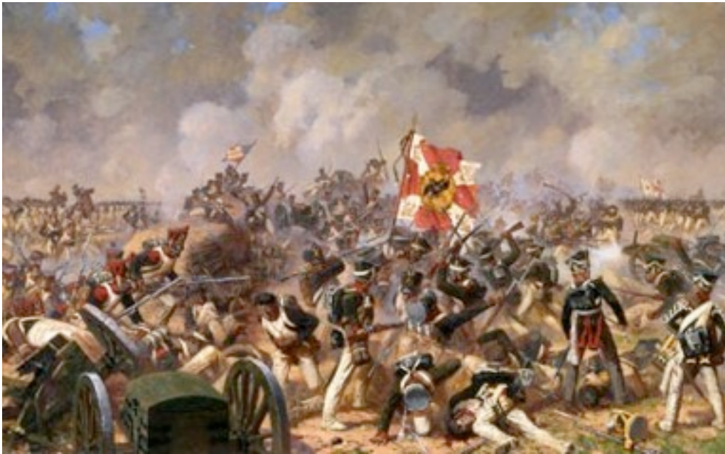
А.Ю.Аверьянов. Бой за Багратионовы флеши.