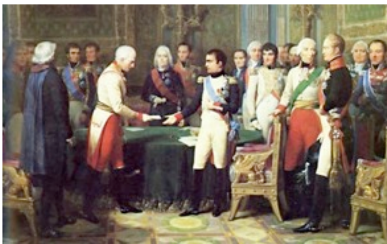
Наполеон принимает австрийского посла барона Винсента в Эрфурте. 1808 г.

Внешне казалось, что Александр I, как и большинство монархов Европы, полностью попал под влияние Наполеона.