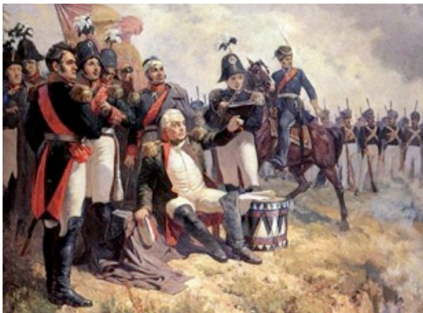
А. Шепелюк. М.И. Кутузов на командном пункте в день Бородинского сражения. 1951 г.

Наполеон планировал захватить левый и правый фланги русских и с 3-х сторон ударить по батарее Раевского.