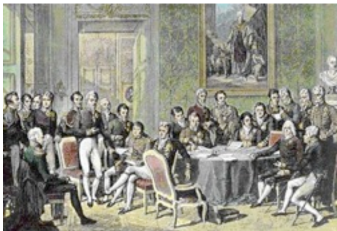
Жан-Баттист Изабе. Венский конгресс. 1819.

Сразу после первого разгрома наполеоновской Франции в 1814 г. в австрийской столице собрался Конгресс держав-победительниц , на котором главную роль играли Англия, Россия, Австрия и Пруссия .