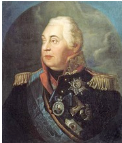
Р.М.Волков. Портрет князя М.И. Кутузова-Смоленского.

«Разбить? Нет, не надеюсь разбить! А обмануть надеюсь!».