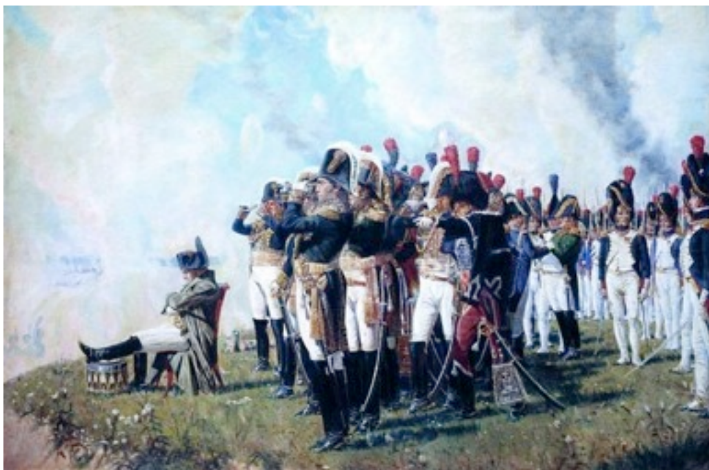
В.В.Верещагин. Наполеон на Бородинских высотах. 1897 г.

Однако в бюллетене, направленном в Париж, было заявлено о победе – Наполеон не мог позволить Европе усомниться в своей силе.