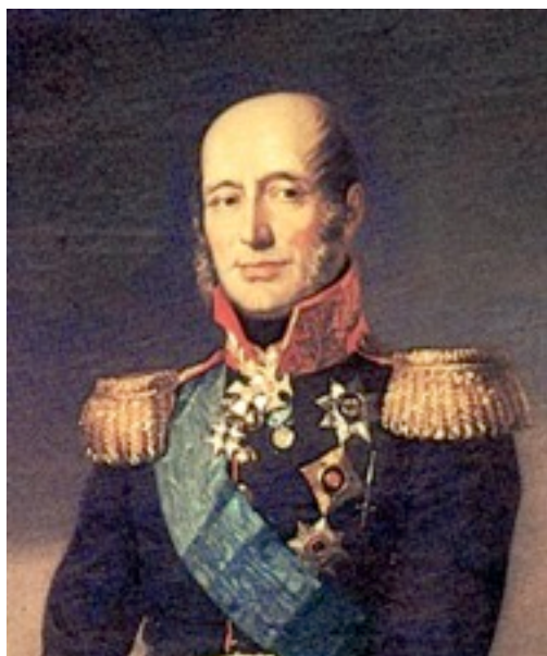
Фрагмент портрета М.Б. Барклая-де-Толли.