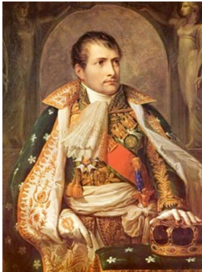
Иконография Наполеона Бонапарта 1799-1815 гг.

Готовя военную кампанию, Наполеон запланировал разгромить русские войска в нескольких генеральных сражениях уже на границе и, спокойно дойдя до Москвы, продиктовать Александру свои условия.