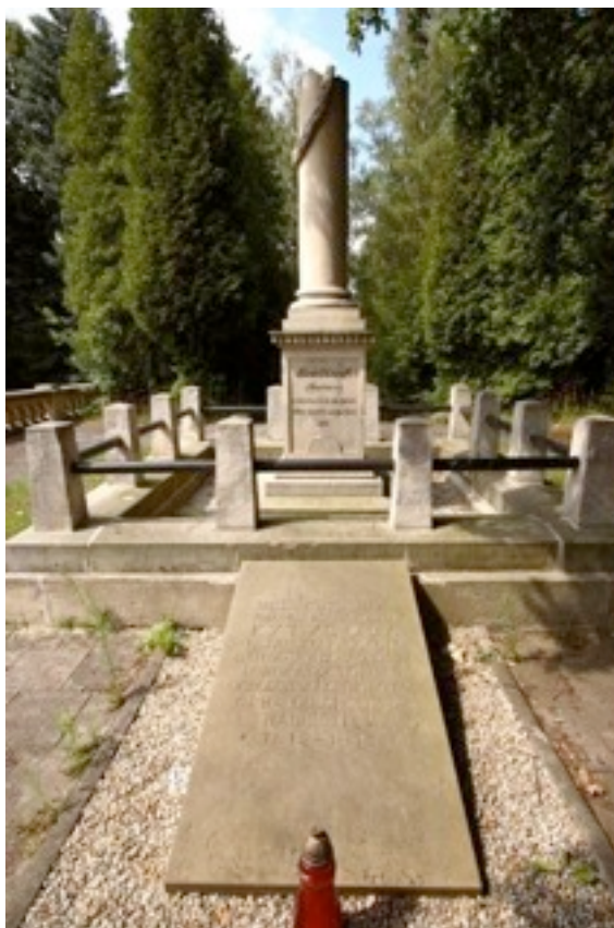
Памятник Кутузову в польском местечке Бунцлау (по одной из версий здесь захоронено сердце полководца)

Поражение Наполеона в России повлекло крах его господства в Европе.