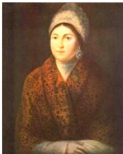
Смирнов А. Портрет Василисы Кожиной. 1813 г.

Как и предполагал Кутузов, захват Москвы принес Наполеону одни лишь проблемы: разброд и дезертирство в армии, назревающий из-за отсутствия продовольствия голод, угроза русских морозов в условиях нехватки топлива.