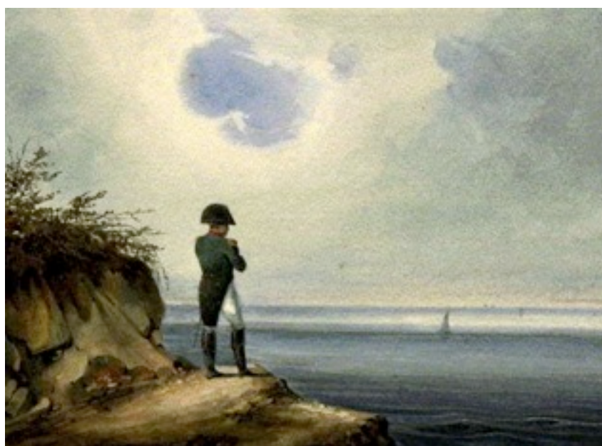
Франсуа-Жозефа Сандмен. Наполеон на острове Святая Елена

« Пленник Европы » был подавлен и морально и физически.