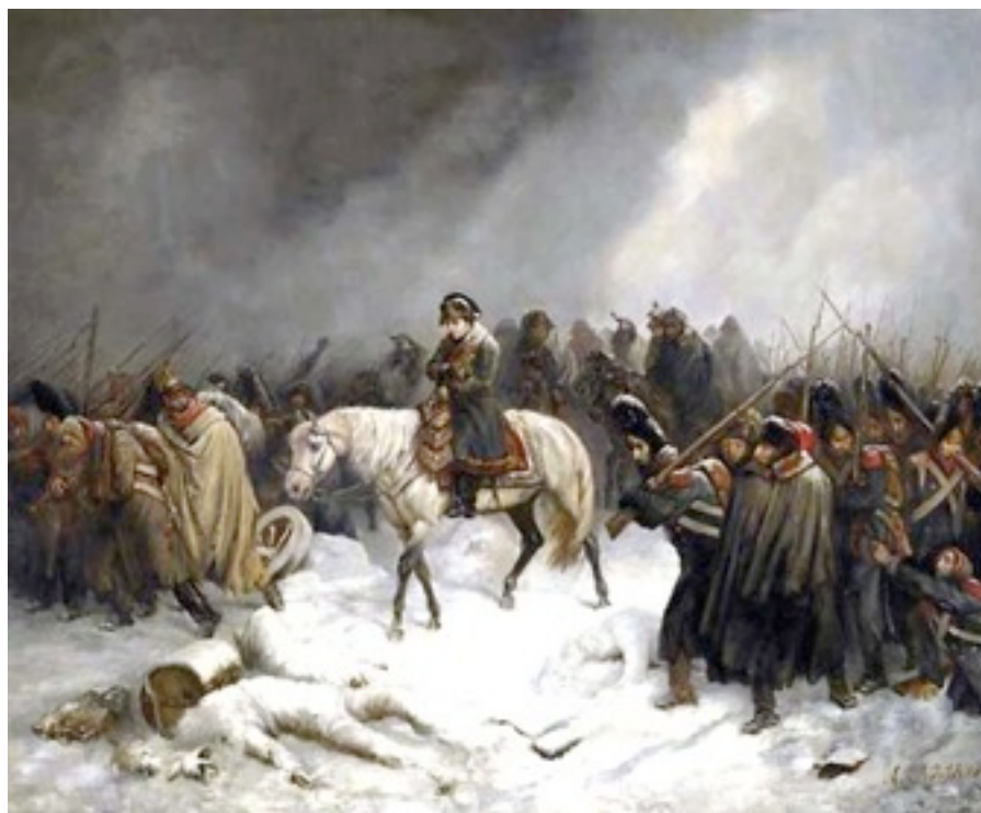
Адольф Нортерн. Отступление Наполеона из Москвы. 1851 год.

«...Голод вынудил их не только есть палых лошадей, но многие видели, как они жарили себе в пищу мёртвое человеческое мясо своего одноземца... Смоленская дорога покрыта на каждом шагу человеческими и лошадиными трупами».