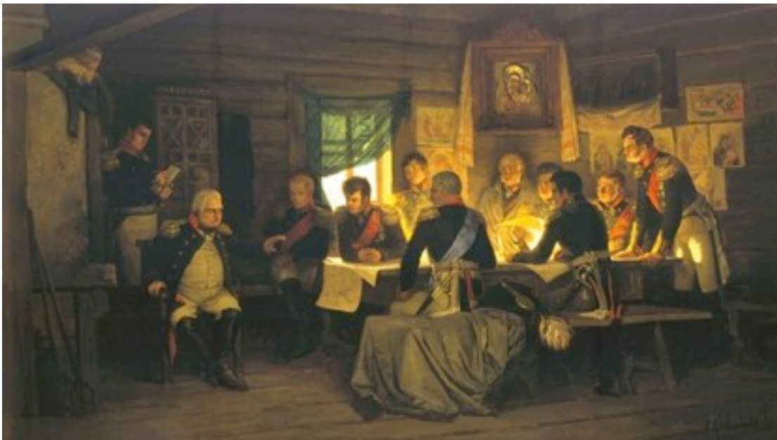
А.Д. Кившенко. Военный совет в Филях. 1880 г.

1 сентября 1812 г. в подмосковной деревне Фили произошло историческое совещание командующих русскими частями, на котором обсуждались дальнейшие действия русской армии.