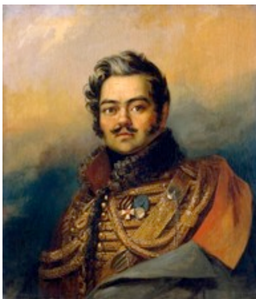
Джорджа Доу. Портрет Д.В.Давыдова.

В Сычевской губернии известность получил партизанский отряд во главе со старостихой хутора Горшково Василисой Кожиной.