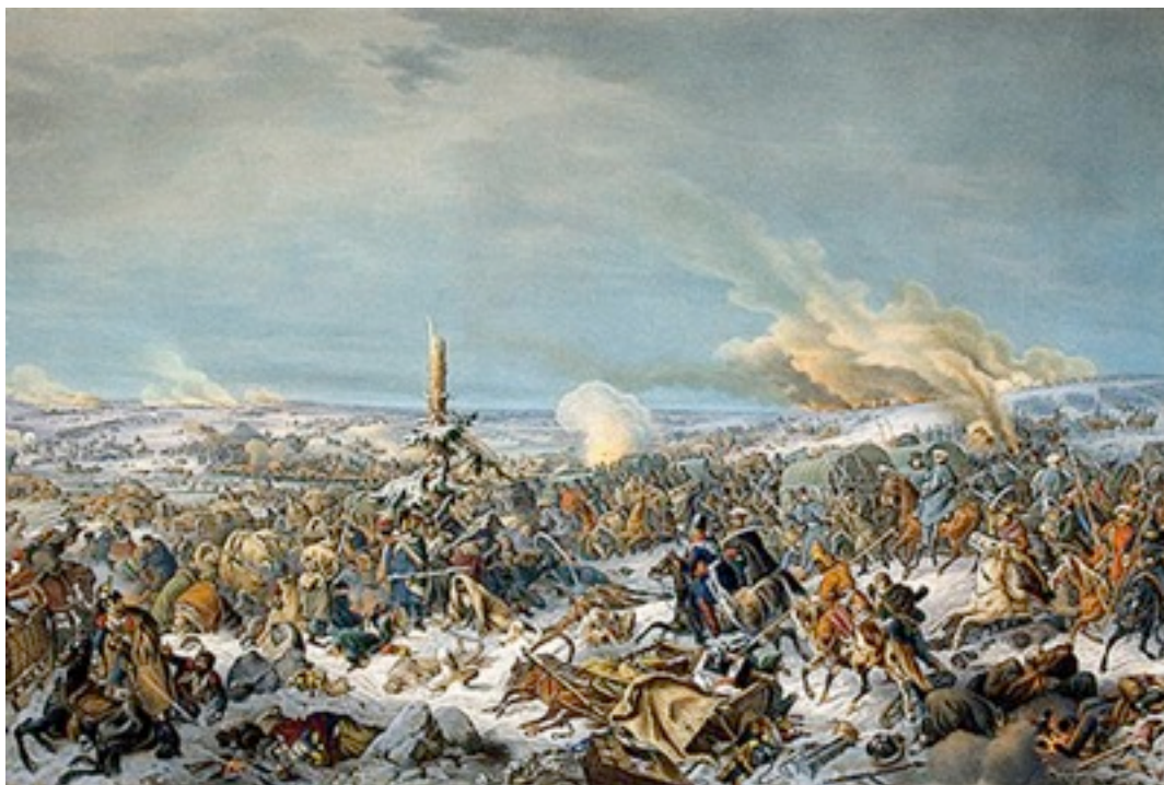
Петер фон Гесс. Переправа через Березину.

Переправа остальных частей, нагруженных награбленным и растерявших дисциплину, больше походила на давку, в которой погибло множество солдат.