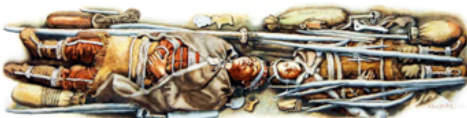
Реконструкция захоронения детей на стоянке Сунгирь

Их похоронили в центре жилища на месте очага, голова к голове, что связано с культом