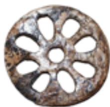
Диск из бивня мамонта.

(С помощью триггера «Захоронение в Сунгире» на экран выводится иллюстрация с реконструкцией захоронений детей на стоянке Сунгирь, и изображения диска из бивня мамонта и фигурки лошади)