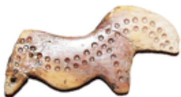
Фигурка лошади (сайги). Амулет.